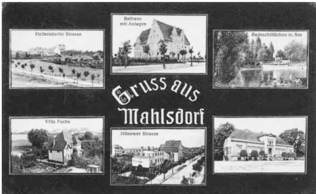
3 Mahlsdorf, verschiedene Motive, Postkarte, um 1919

Der Erste Weltkrieg führte auch in Mahlsdorf, Kaulsdorf und Hellersdorf zunehmend zu Entbehrungen. Die Lebensmittel wurden rationiert, das Schlangestehen nach Lebensmitteln gehörte zum Alltag. Wie im ganzen Deutschen Reich kam es zu immer stärkeren Protesten. Friedrich Himpel, Vorsitzender des Sozialdemokratischen