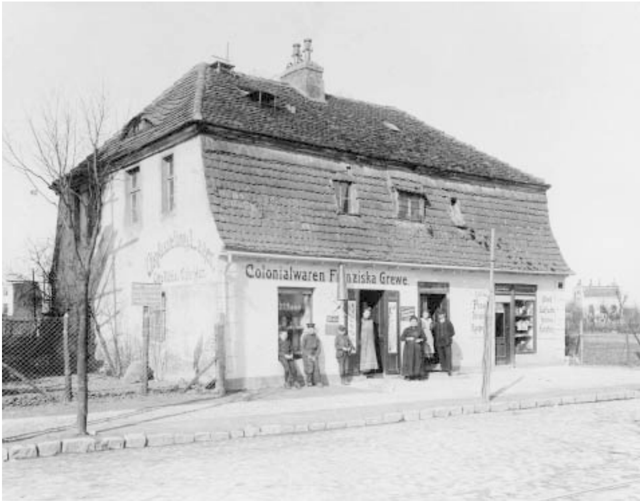
2 Ehemaliges Mahlsdorfer Müllerhaus, Postkarte, um 1910