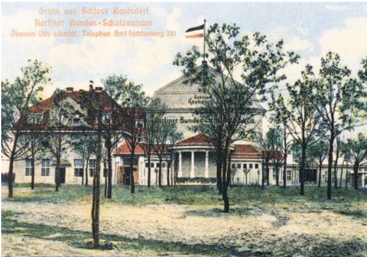
1 Kaulsdorf, Hellersdorfer Weg 1–5, Berliner Bundesschützenhaus, Postkarte, um 1910

in wesentlichen Teilen auch realisierten Gartenstadt-Siedlungen in Mahlsdorf dokumentieren exemplarisch die Zeit-, Bau- und Sozialgeschichte der 1920er Jahre. Mit Bruno Taut hat ein Architekt von Weltgeltung seine Spuren in diesem Ort hinterlassen.