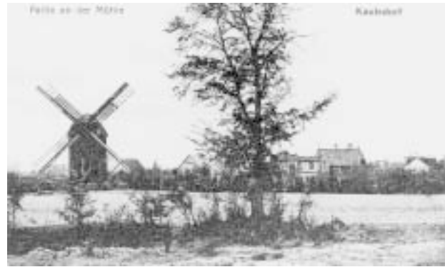
6 Mühle von Kaulsdorf, Postkarte, um 1910

Die Sozialstruktur Kaulsdorfs und Mahlsdorfs ließ die beiden Parteien der Arbeiterschaft, KPD und SPD, in den Jahren der Weimarer Republik politisch dominieren, was