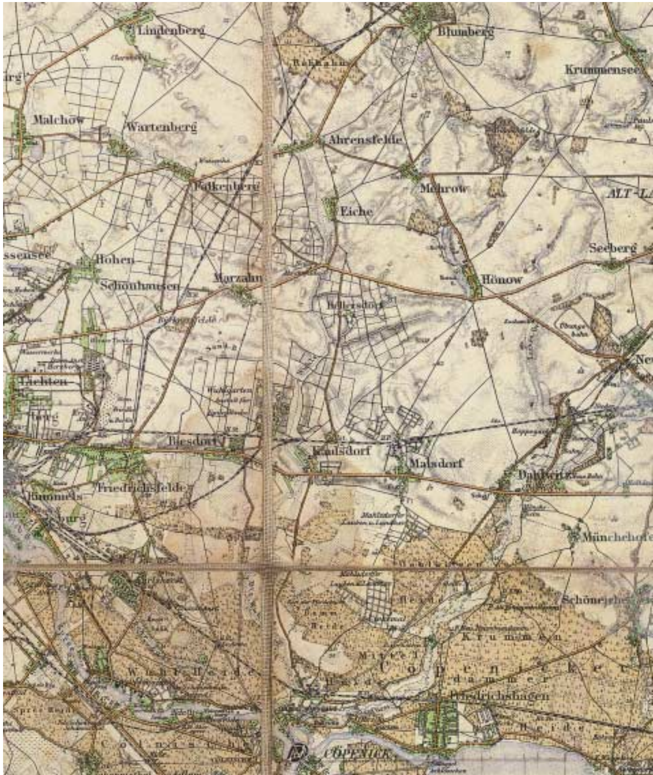
4 »Karte der Umgegend von Berlin«, M = 1:10 000, 1898, Kartenausschnitt