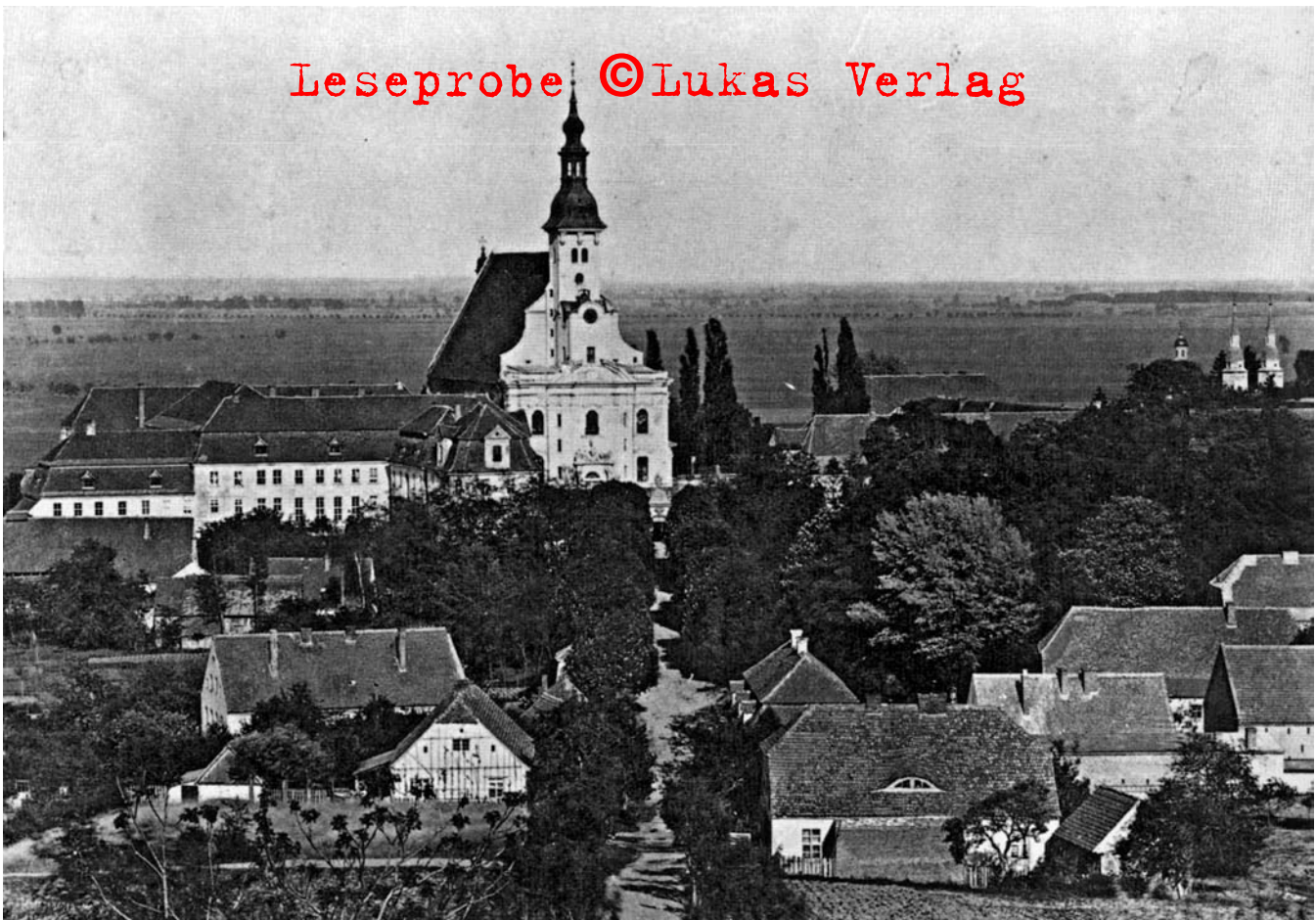
3 Kloster Neuzelle, Gesamtanlage von Westen, im Hintergrund Oderniederung, Aufnahme um 1880

nerischen Anlagen sowie der Restaurierung der künstlerischen Ausstattung des früheren Zisterzienserklosters vor allem die Präsentation und die öffentliche Erschließung des wertvollen Denkmalensembles wesentlich verbessert werden.