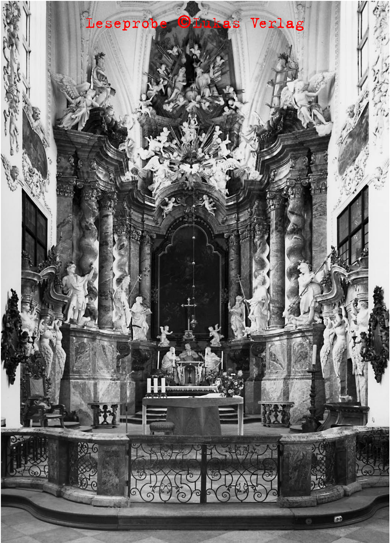
1 Kloster Neuzelle, Klosterkirche St. Marien, Blick auf den Hochaltar, Aufnahme 31.8.1993