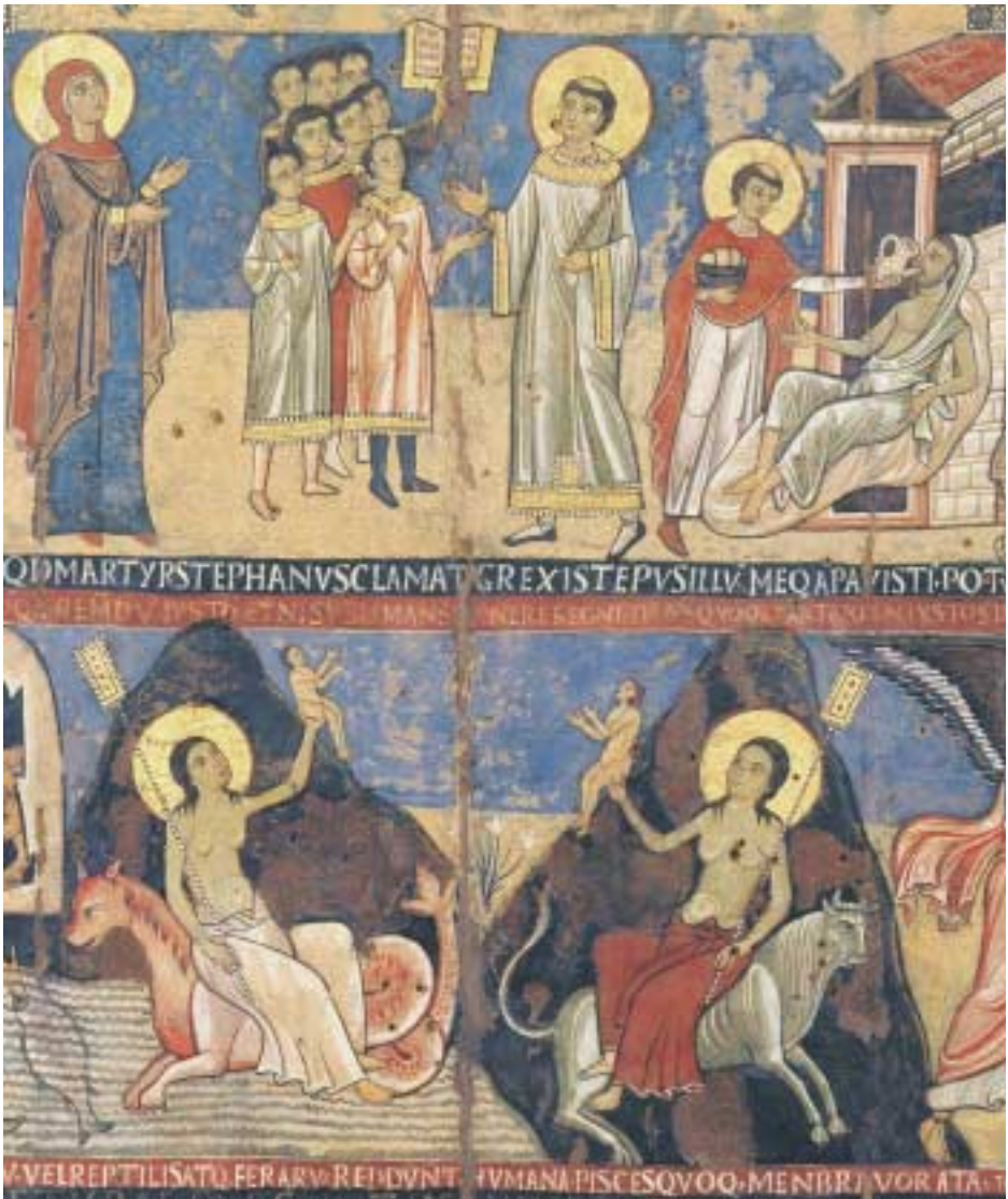
Tafel 5 Jüngstes Gericht (Detail: Mitte unten), Tafelbild aus S. Maria di Campo Marzio, Rom, Pinacoteca Vaticana