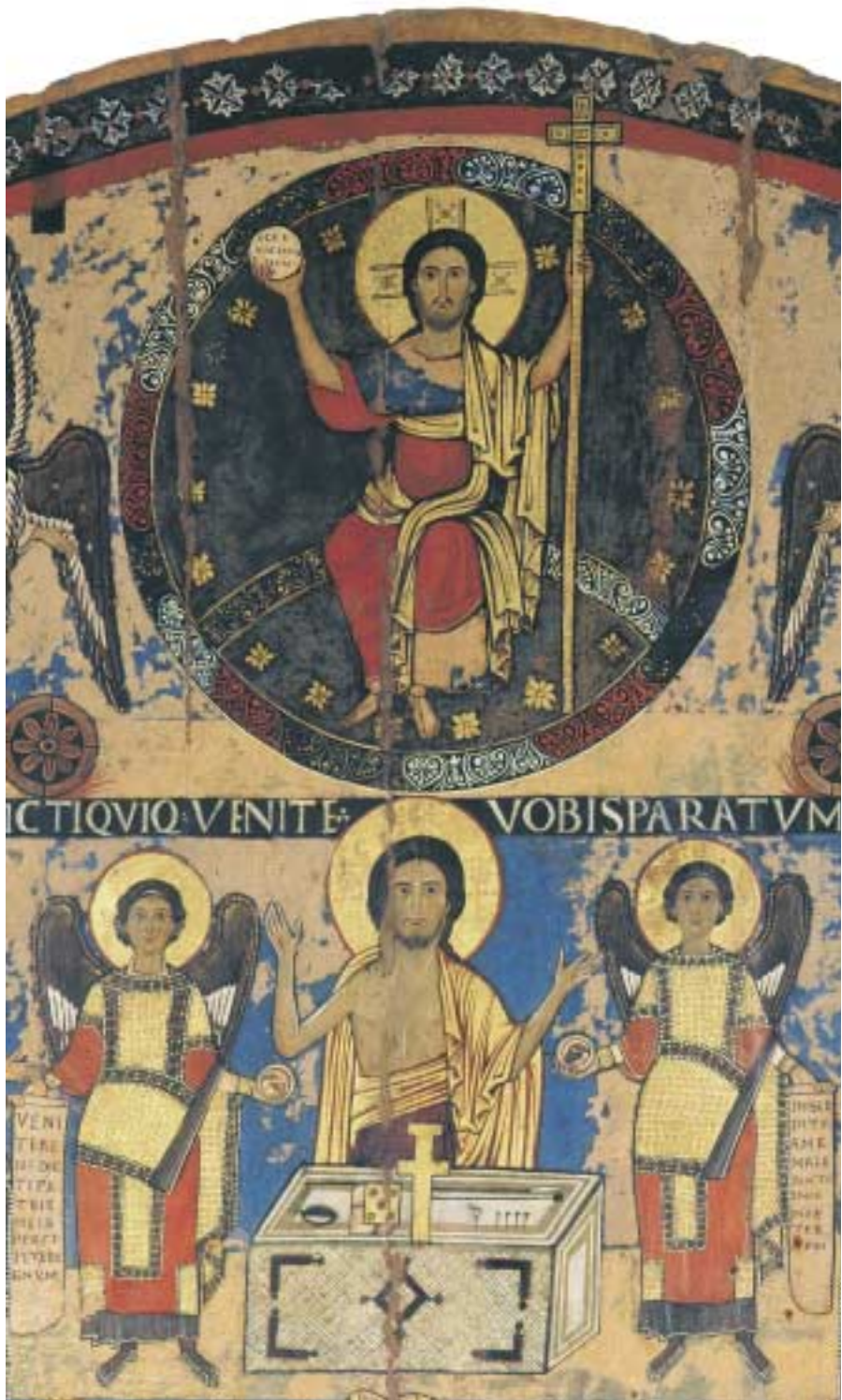
Tafel 4 Jüngstes Gericht (Detail: Mitte oben), Tafelbild aus S. Maria di Campo Marzio, Rom, Pinacoteca Vaticana