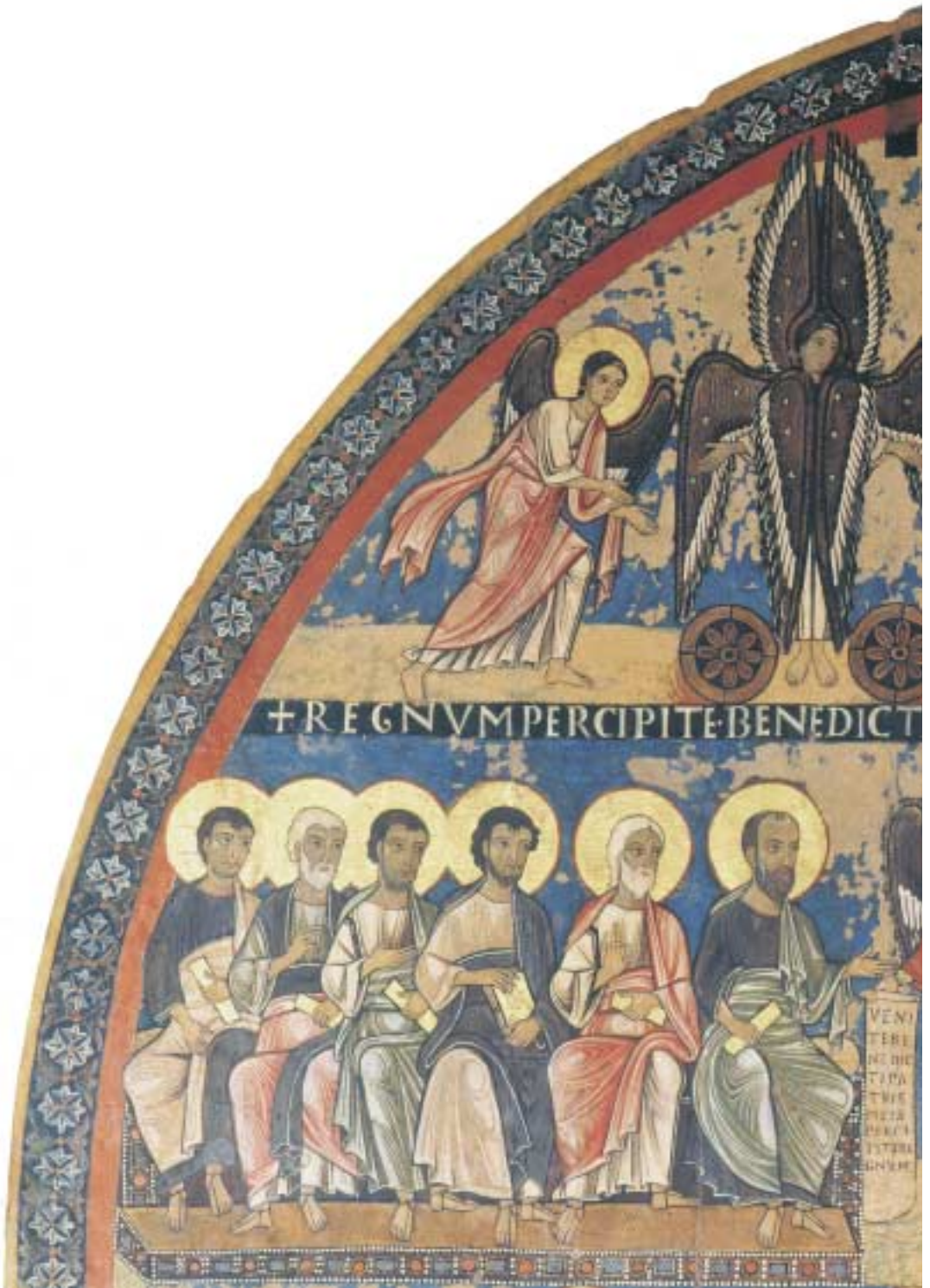
Tafel 3 Jüngstes Gericht (Detail: links oben), Tafelbild aus S. Maria di Campo Marzio, Rom, Pinacoteca Vaticana