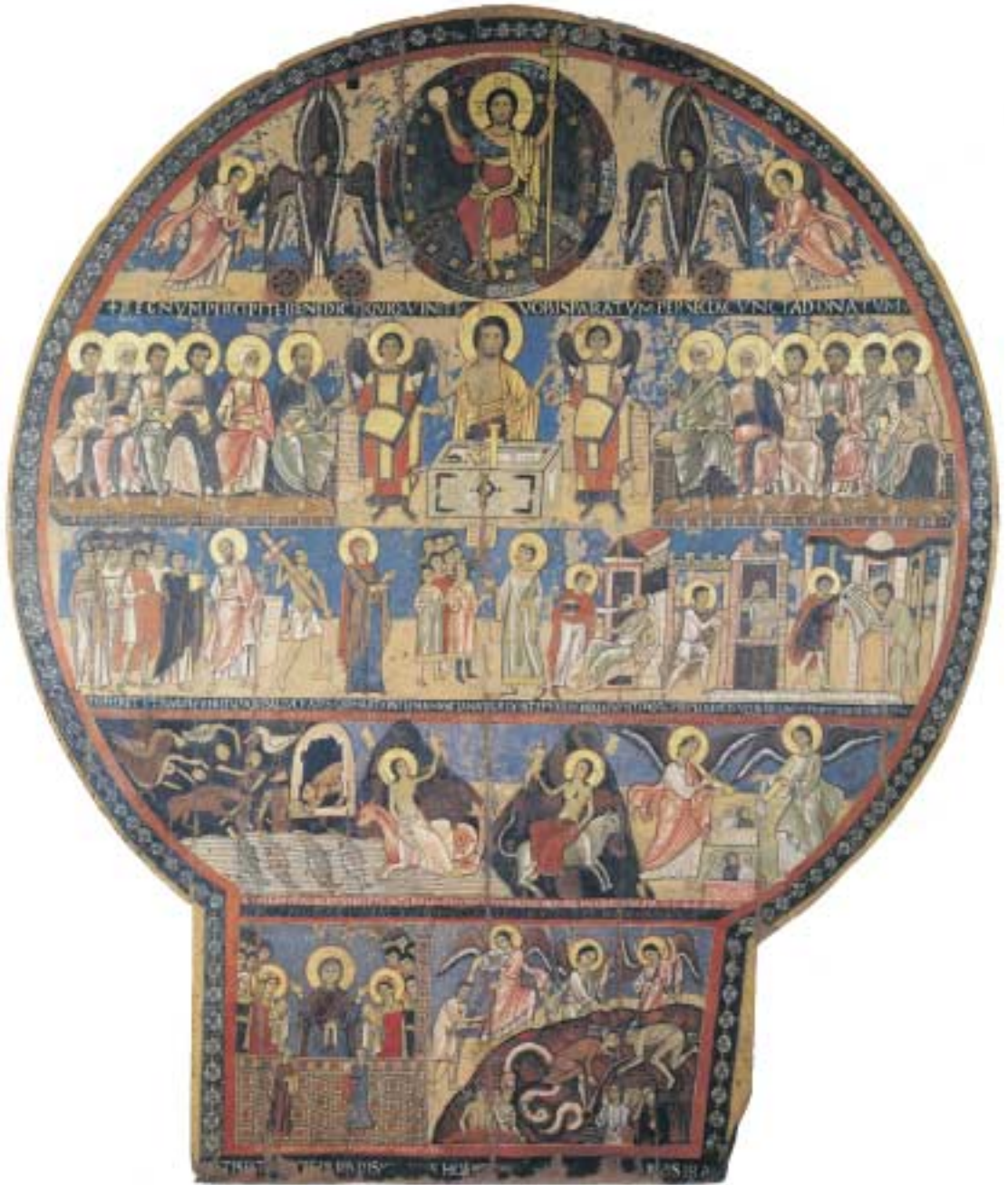
Tafel 1 Jüngstes Gericht, Tafelbild aus S. Maria di Campo Marzio, Rom, Pinacoteca Vaticana Vaticano, Pinacoteca