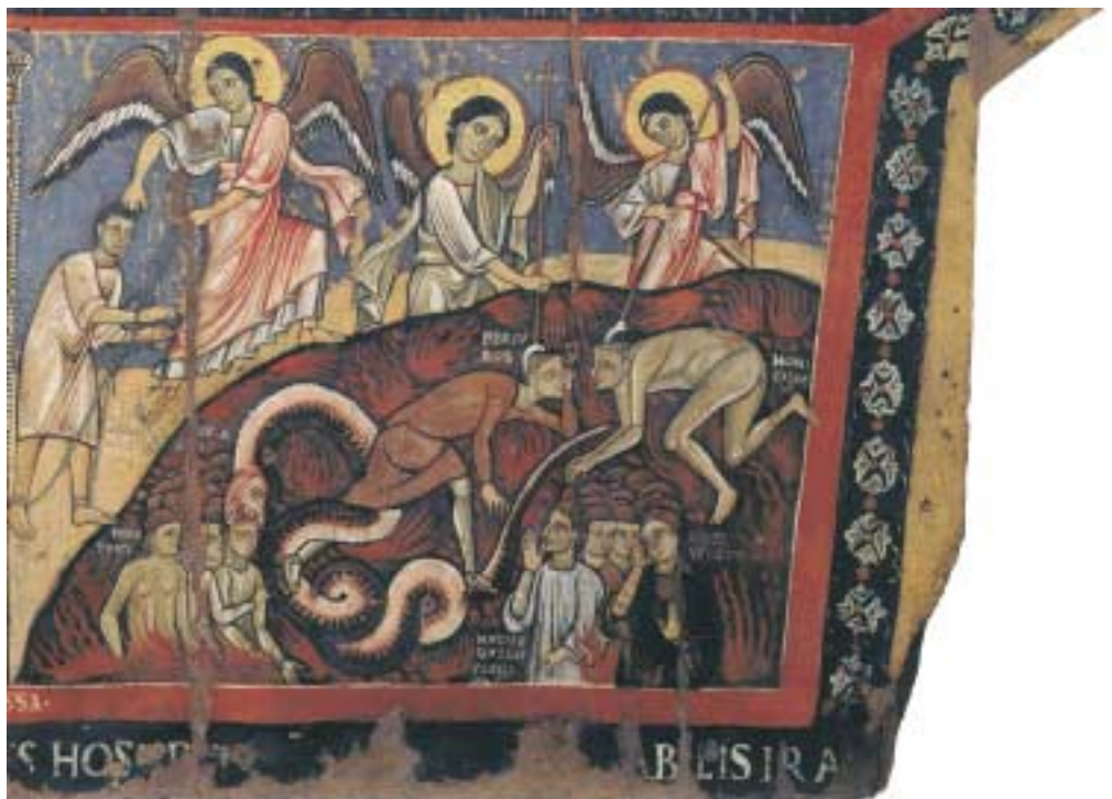
Tafeln 8a+b Jüngstes Gericht (Details: unten links und rechts), Tafelbild aus S. Maria di Campo Marzio, Rom, Pinacoteca Vaticana Vaticano, Pinacoteca