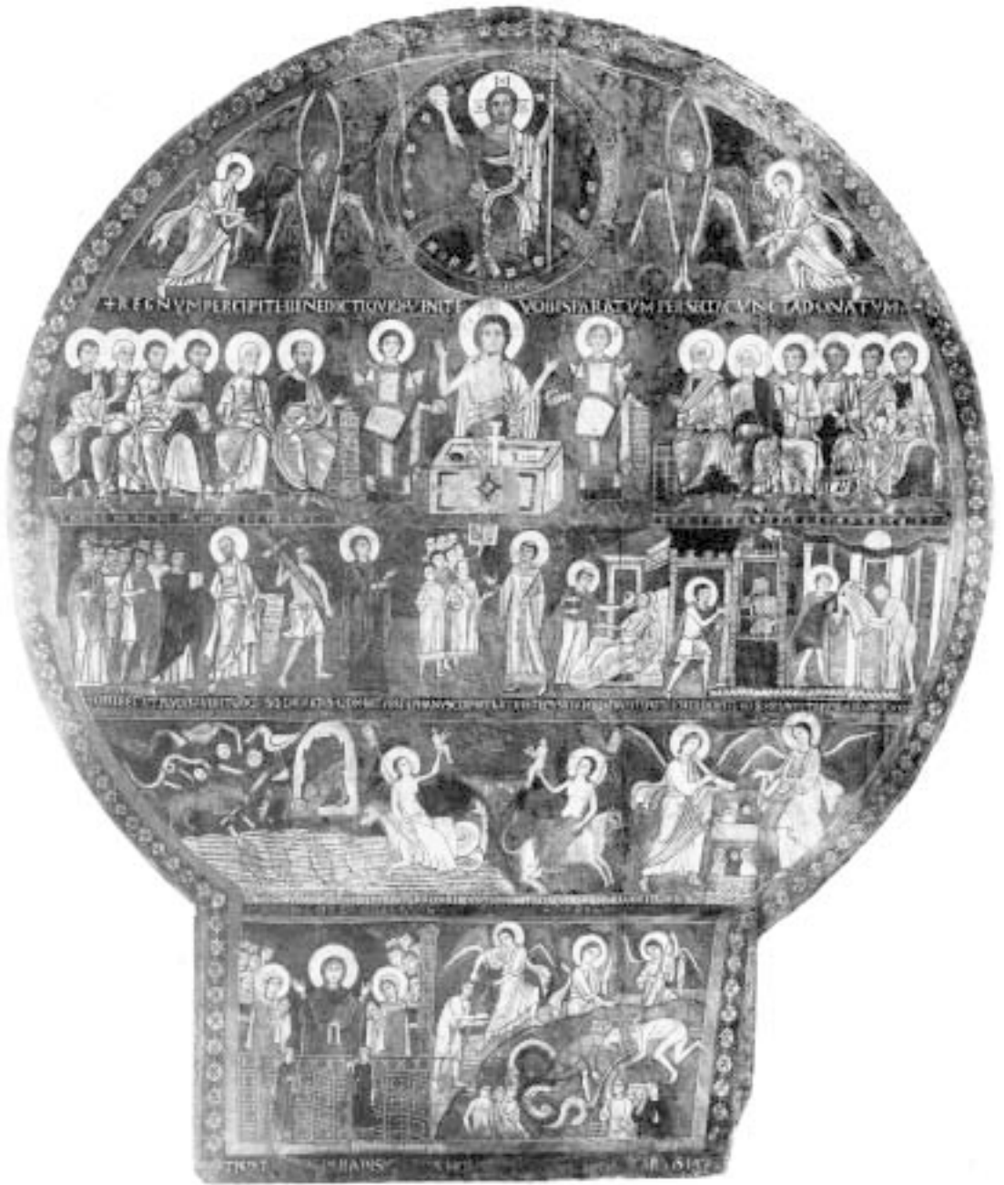
1 Jüngstes Gericht, Tafelbild aus S. Maria di Campo Marzio, Rom, Pinacoteca Vaticana Musei Vaticani, Archivio Fotografico