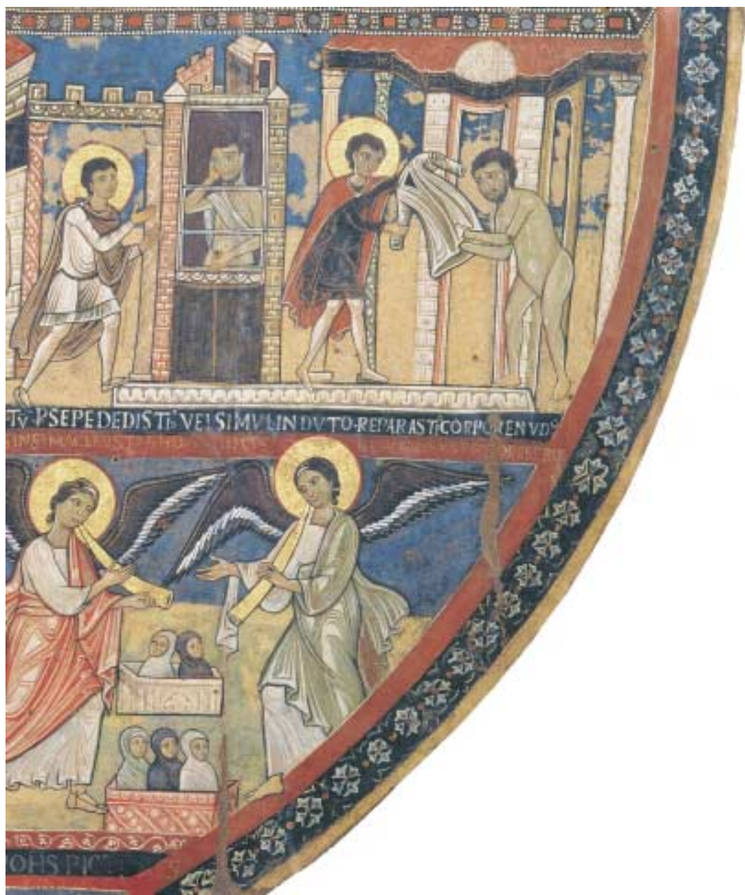
Tafel 7 Jüngstes Gericht (Detail: rechts unten), Tafelbild aus S. Maria di Campo Marzio, Rom, Pinacoteca Vaticana