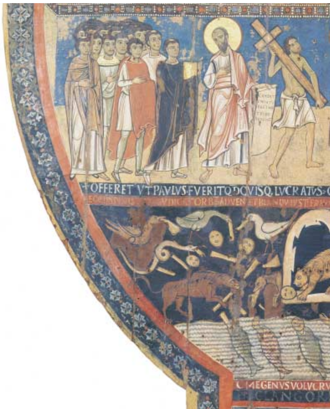
Tafel 6 Jüngstes Gericht (Detail: links unten), Tafelbild aus S. Maria di Campo Marzio, Rom, Pinacoteca Vaticana, Foto A. Bracchetti