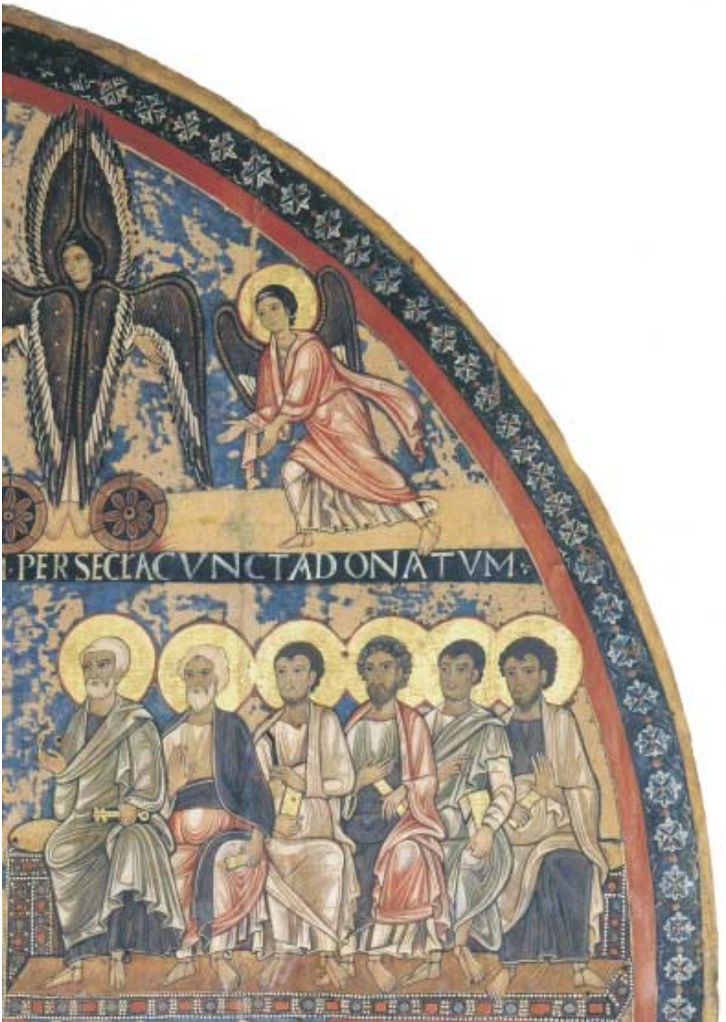
Tafel 3 Jüngstes Gericht (Detail: rechts oben), Tafelbild aus S. Maria di Campo Marzio, Rom, Pinacoteca Vaticana