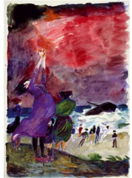
23 (links) Der Schiffbruch, 1958, Öl auf Leinwand, 130 × 97 cm, Kulturstiftung Rügen