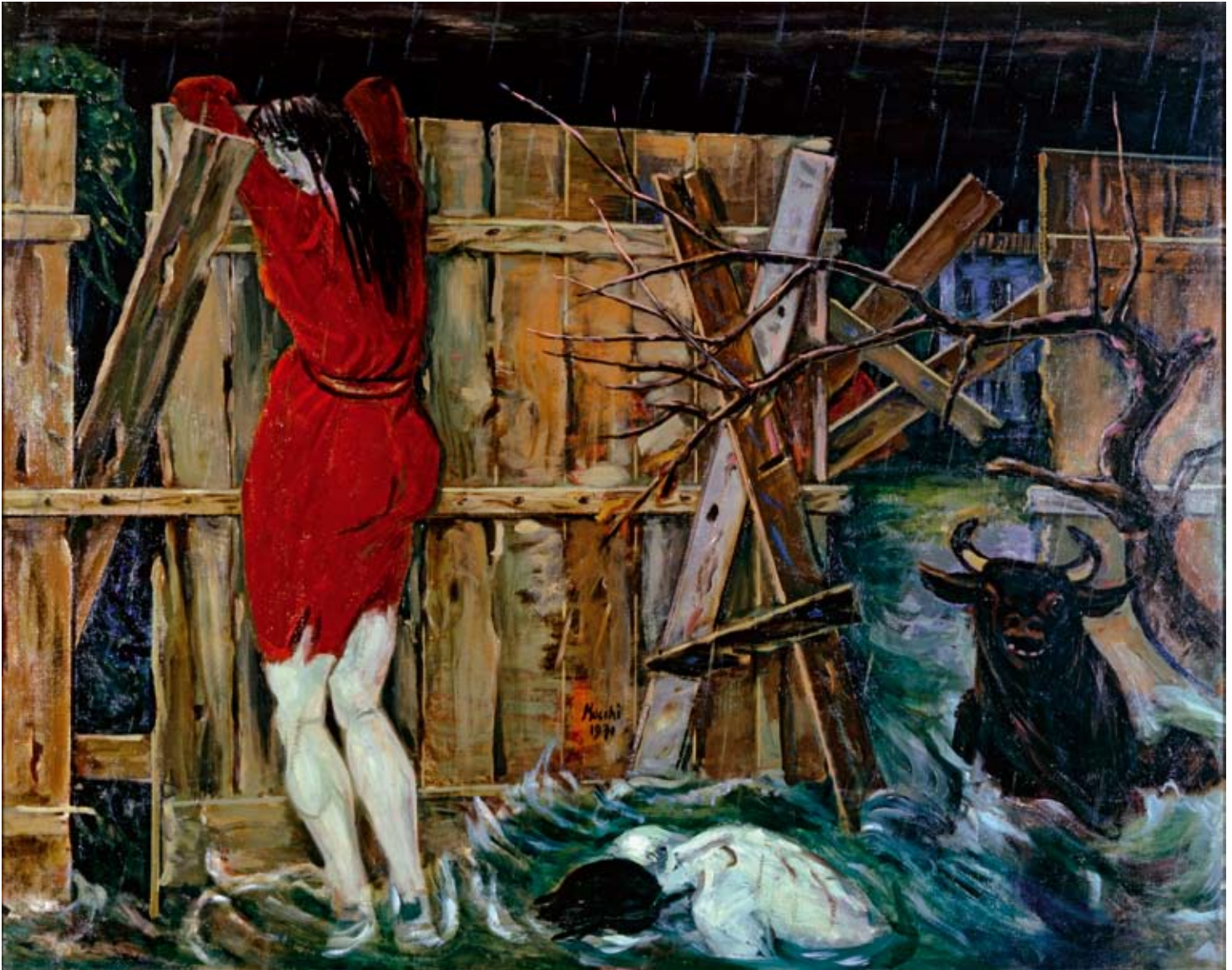
22 Überschwemmung, 1971, Öl auf Leinwand, 120×150 cm, Privatbesitz